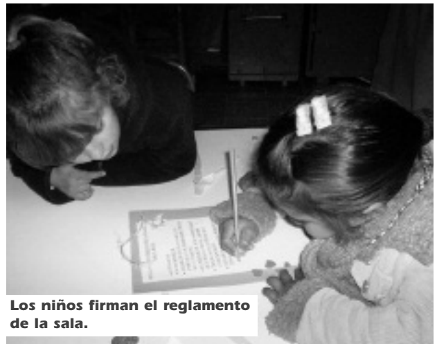
Los niños firman el reglamento de la sala.