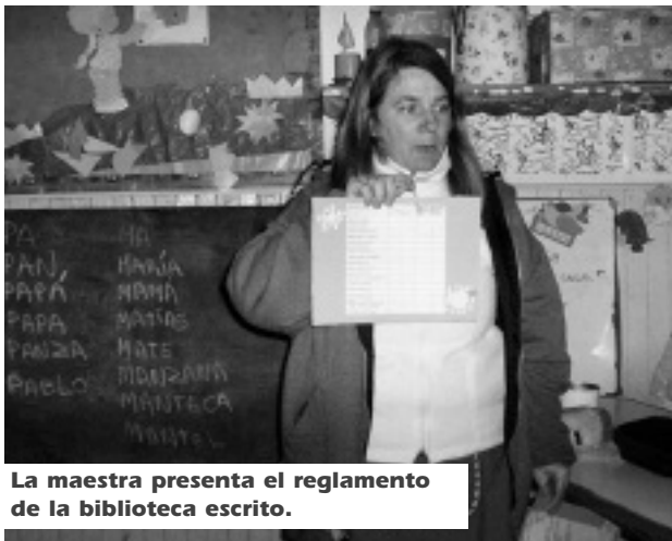
La maestra presenta el reglamento de la biblioteca escrito.

La maestra explica cómo se organizarán para hacer la devolución de los libros que se llevan a casa y muestra el fichero de la sala.