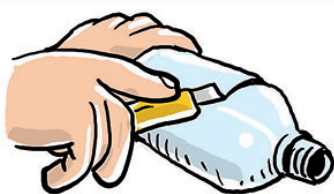
1 Cortar la botella