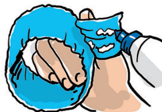
4 Pegar las terminaciones con plasticola o adhesivo para tela.