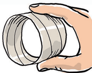
2 Forrar con cinta de embalar